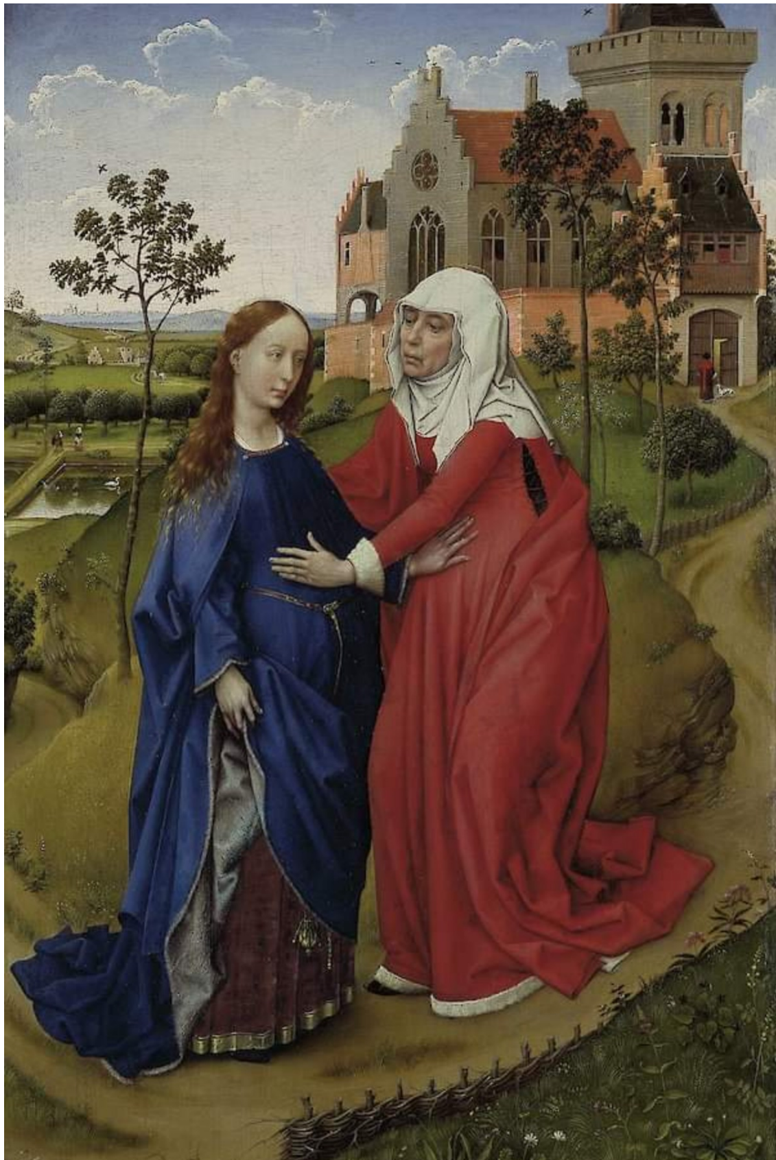
“Visitazione” di Pieter Paul Rubens