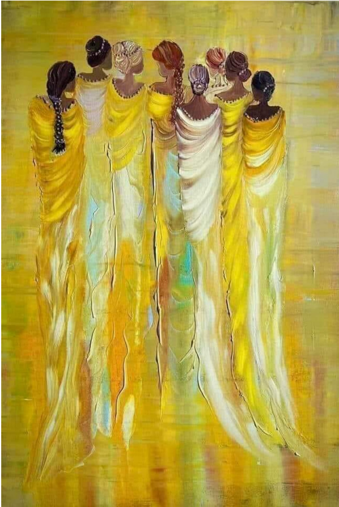
“Orizzonti”di Andrejus Kovelinas