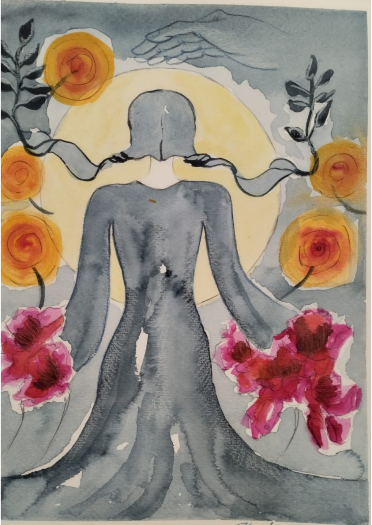
(illustrazione di Kamela Guza)