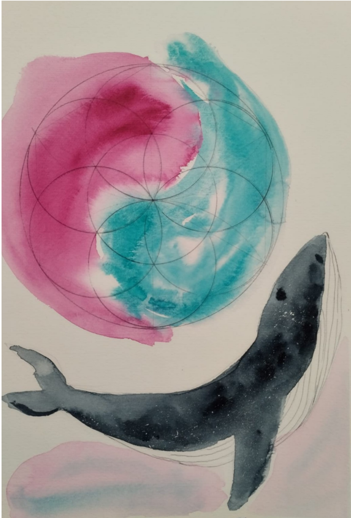
(illustrazione di Kamela Guza)